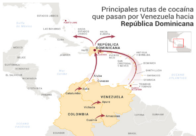
Mapa 3.

de que este tipo de actividad es muy antigua, la cultura criminal actual se ha desarrollado en menos de cien años y gracias a la corrupción el sistema se ha hecho prácticamente inamovible. De ahí que no pueda existir Crimen Organizado sin la complicidad del Estado (Morín, 2015).