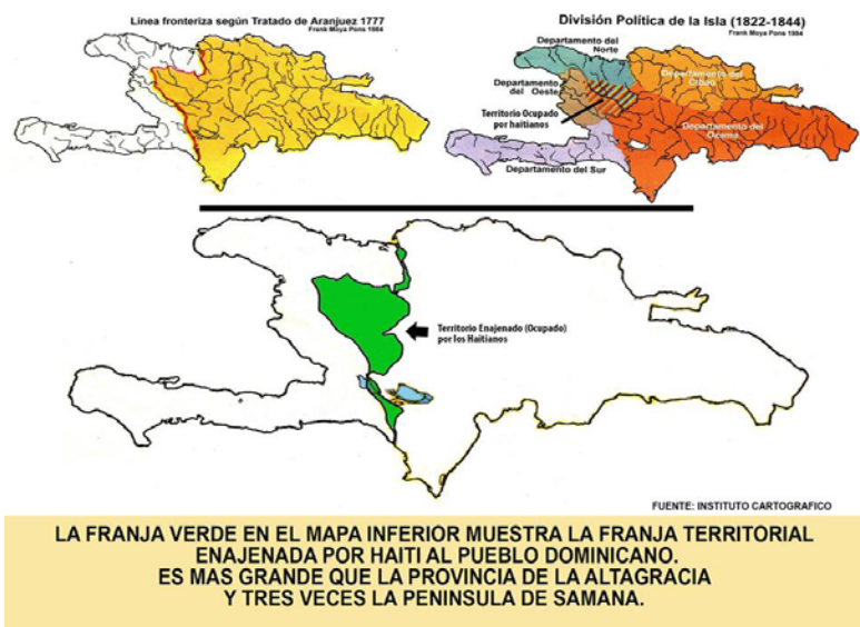
Mapa 2.

de la guerra de independencia dominicana los haitianos ocuparon las tierras de Hinchá, San Rafael, Las Caobas y San Miguel de la Atalaya; una franja de 5,613 km 2 que había formado parte del territorio histórico de los dominicanos desde el Tratado de Aranjuez. El 21 de enero de 1929 se estableció el Tratado de Fronteras Domínico-Haitiano, que refrendó la ocupación de los territorios antes mencionados (ver mapa 2). Ese tratado consta de un Protocolo de Revisión del 9 de marzo de 1936 y un Anexo a dicho protocolo del 15 de marzo de 1936.